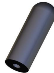
RUBBER Loofvinger 110 x 24 (Binnen 8mm) 72° Shore A