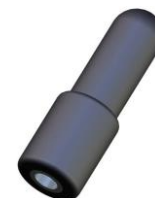
RUBBER Loofvinger 70 x 23/17,5 (Binnen 8mm) 72° Shore A