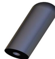
RUBBER Loofvinger 78 x 25 (Binnen 8mm) 72° Shore A