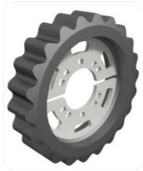
GW 32-22 S

STEЕК: 32 \varnothing : 260 Breedte: 60 Tandен: 22 Losse prop