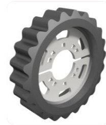
GW 40-18 S

STEЕК: 35 \varnothing : 260 Breedte: 60 Tandен: 20 Losse prop