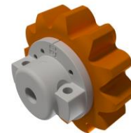
Brede ZP 32-12

STEЕК: 32 \varnothing : 178 Breedte: 22 Tandен: 14 Losse prop