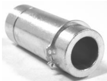
Open As M16 M20